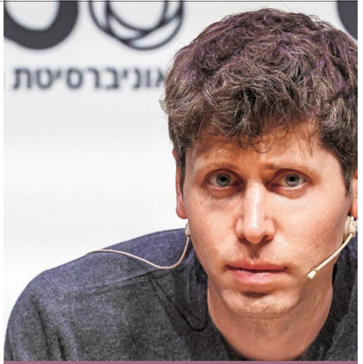
Sam Altman, de ontwikkelaar van ChatGPT, lanceerde vorige week de Worldcoin, een digitale munt.

In dat gat probeert Worldcoin nu te stappen, door niet alleen een munt aan te bieden, maar ook een identiteitsbewijs. Om dat identiteitsbewijs te bevestigen, moet je je oogbal laten scannen op een speciale locatie van Worldcoin. Daarvoor kun je in Europa bijvoorbeeld al in Berlijn en Parijs terecht. Op het gebruik van iris-scans voor dit doel klinkt echter kritiek. 'Als al die gegevens op één plek worden opgeslagen, is dat een