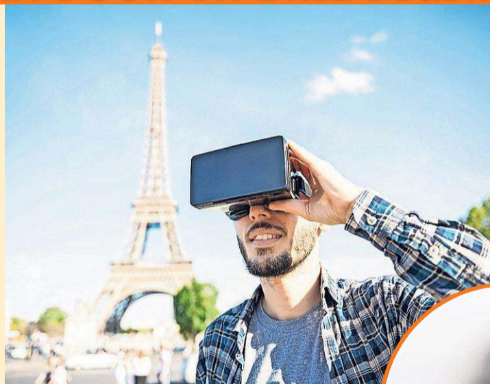
Even een VR-bril opzetten en je waant je midden in Parijs.

inspireren. Al zal volgens de boekingsgigant nog niet 'de zonnebril worden ingeruild voor de VR-bril'; de twee bestaan vooral naast elkaar. Ook andere reisbedrijven geven aan vooral aan de slag te willen met VR, maar zijn doorgaans nog sceptisch dat vakanties vervangen zullen worden, klinkt het in de sector.