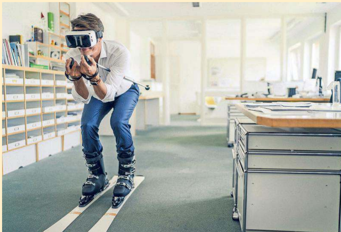
Fysiek op kantoor, maar dankzij de VR-bril met huiveringwekkend scherpe beeldkwaliteit tegelijkertijd midden in een winterse wereld.